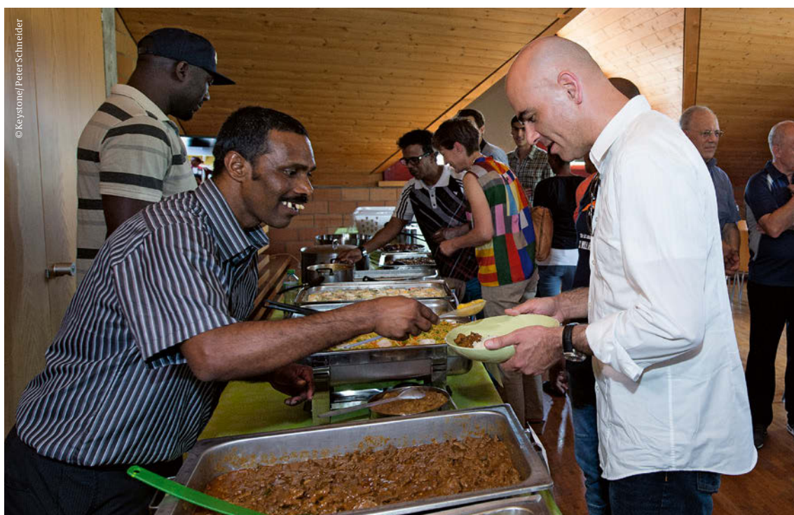
Das Durchgangszentrum in Riggisberg entstand auch durch das Engagement der Kirchgemeinde: Der Bundesrat würdigte das Projekt mit einem Besuch.

Die Kirchen haben aber auch eine kulturelle Rolle. Dies vor allem deshalb, weil die Kultur des Abendlandes vom Christentum geprägt ist. Die Kirchen sind Bewahrer dieser Traditionen, und innerhalb ihrer Mauern ertönen oft Chorgesänge, Orgelkonzerte oder andere liturgische Musikformen. In Kirchen oder Kirchgemeindehäusern werden Theaterstücke, Filme, literarische Lesungen, Tanzaufführungen oder Ausstellungen durchgeführt. Von den Fenstern der Räumlichkeiten der Reformierten Kirchen Bern-Jura-Solothurn in Bern sind Glockentürme von fünf verschiedenen Kirchen zu sehen. Die kirchlichen Gebäude prägen das Bild und die visuelle Identität der Bundesstadt. Die Kirchgemeinden seien für ihre Aktivitäten genau genommen nicht wirklich auf so viele Gebäude angewiesen, bemerkt Matthias Zeindler. So kostet etwa das Münster Millionen von Franken, und die reformierten Kirchen könnten erhebliche Einsparungen machen, wenn sie das Münster abtreten würden. Allerdings wäre niemand mit einem derartigen Vorschlag einverstanden. Der Professor sieht darin ein Zeichen für die Verbundenheit der Bevölkerung mit dem kirchlichen Erbe. Auf der anderen Seite unterstützen die Kirchen moderne Kunst und fördern architektonische Innovationen.