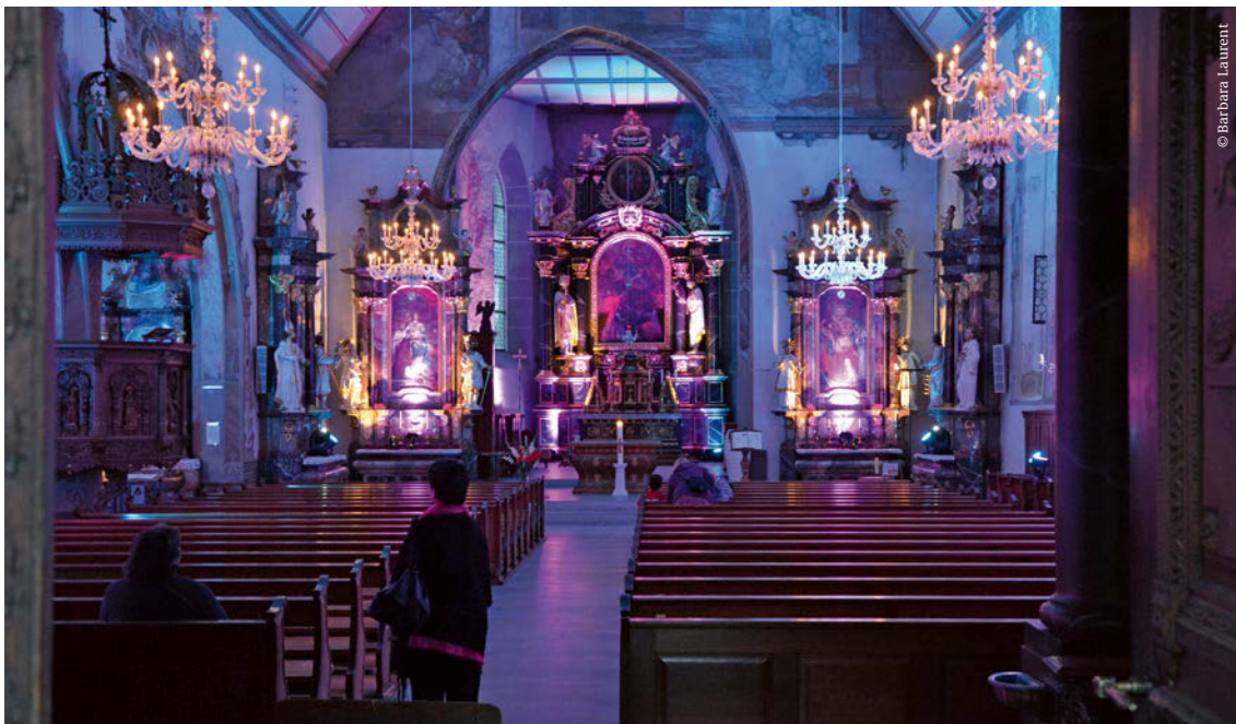
Lange Nacht der Kirchen 2016 in Bremgarten, Aargau.