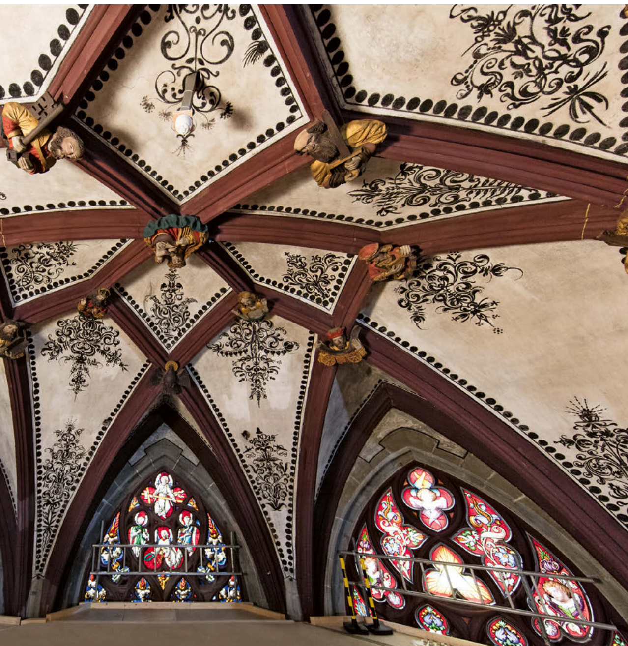
Les Eglises préservent le patrimoine culturel: la restauration du plafond de la cathédrale, Berne.

Mais les Eglises jouent également un rôle culturel indéniable, avant tout parce que la culture occidentale est imprégnée du christianisme. Elles sont