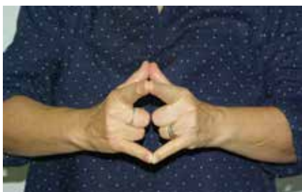
«L'église en langue des signes».

L'association «EinElternForum» (Forum familles monoparentales), portée par Refbejuso et CARITAS, a été dissoute. Elle a cessé la publication de son journal