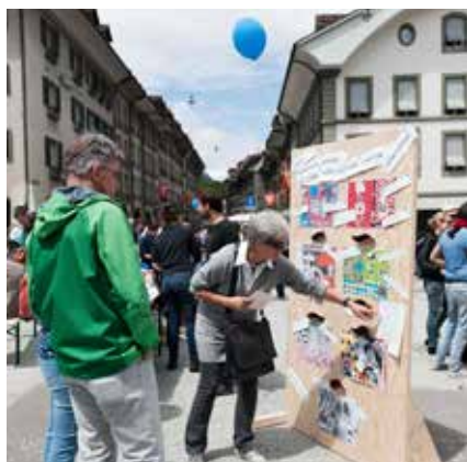
Fête du centre bernois de conseil pour sans-papiers.