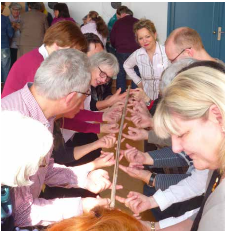
Le travail en équipe exercé d'une manière ludique.