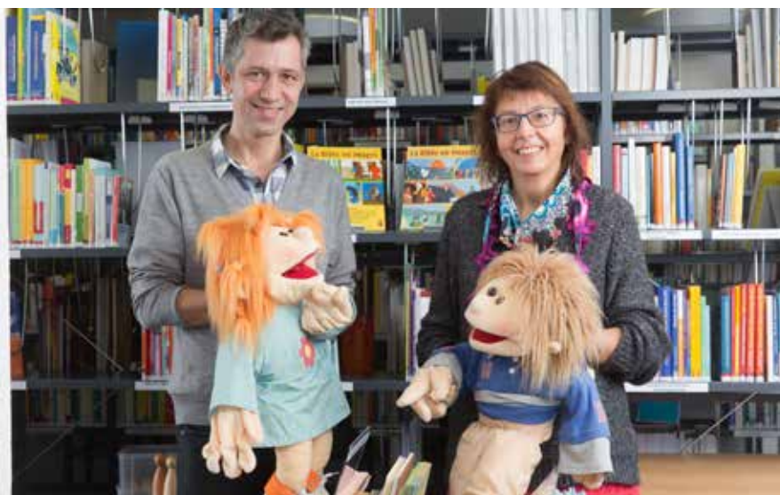
La formation, l'apprentissage et l'enseignement de la catéchèse ont été formulés dans une «vision».