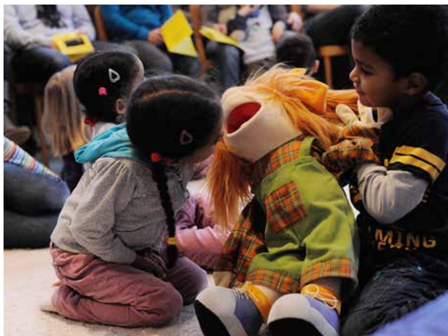
Peuvent être empruntées auprès des bibliothèques ecclésiales: les marionnettes, supports à la narration d'histoires pour les plus petits.