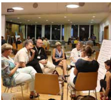
Les photos sur cette page et les pages suivantes ont été prises lors de la conférence organisée à Soleure dans le cadre des conférences conjointes 2015.

■ Seeland: L'arrondissement du Seeland renonce à présenter un rapport.