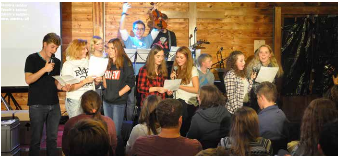
Des participantes et participants motivés lors du Camp de confirmation à Vaumarcus.

■ Nous voulons permettre aux individus d'évoluer avec assurance tant dans leur vie que dans l'exercice de leur profession. Nous répondons de la