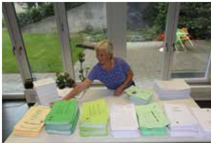
La masse des documents de décision pour le synode est prête à l'expédition.