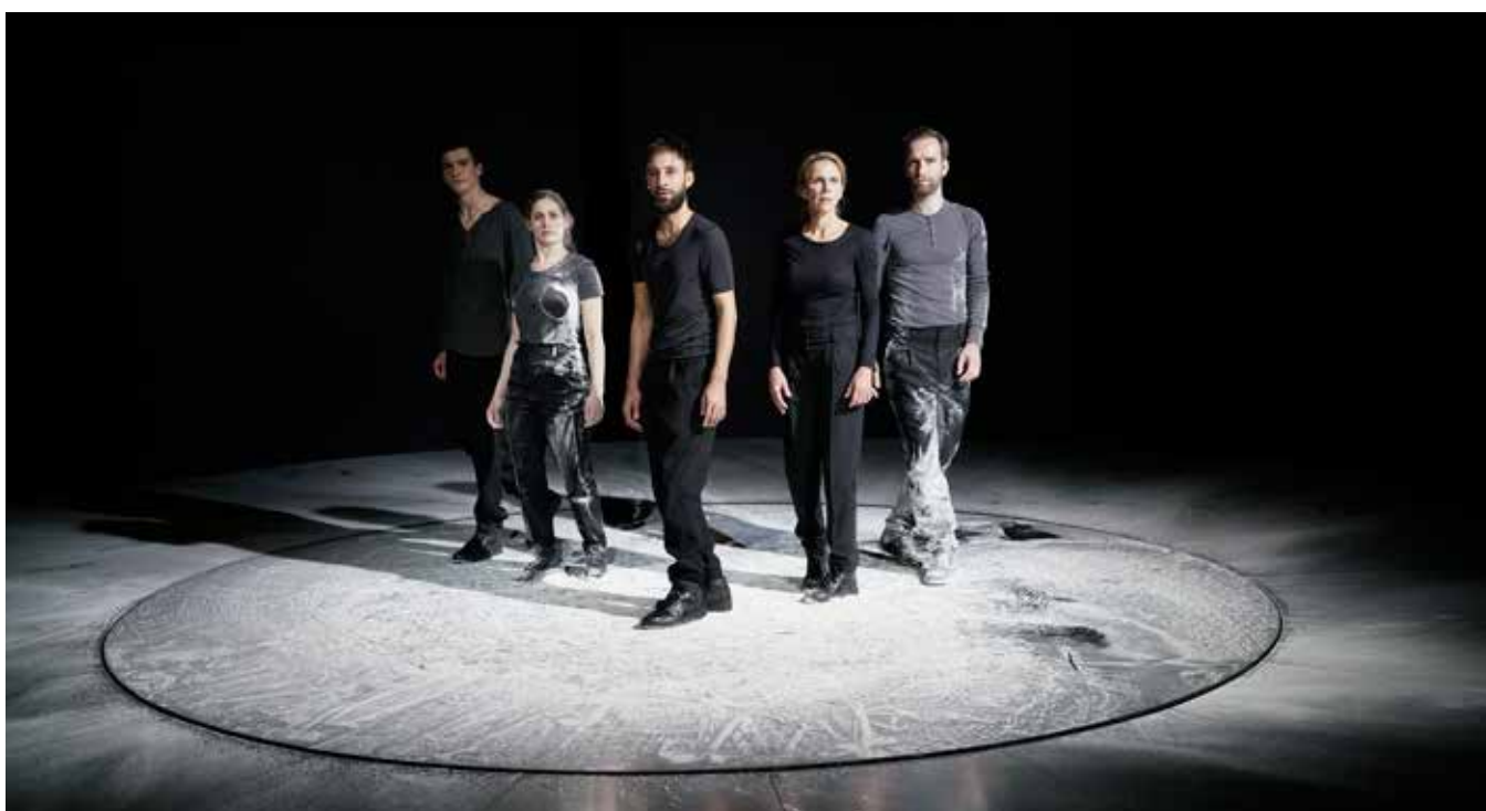
Une collaboration exemplaire entre le théâtre et l'opéra de Berne et les paroisses de la ville et de la région de Berne.

responsable du secteur Paroisses et formation et l'ensemble des collaboratrices et collaborateurs