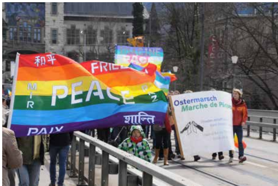
Marche de Pâques, le lundi de Pâques à Berne.