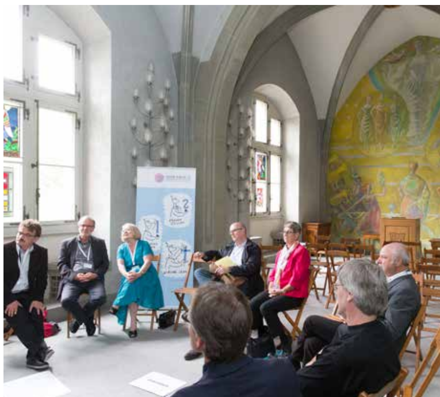
Etape-relais 1 du processus «Vision Eglise 21 – dessiner l'avenir ensemble»: un groupe de députées et députés rassemble les questions.