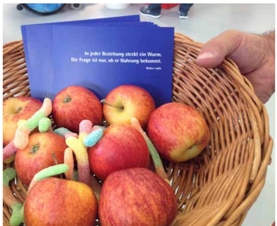
Des pommes et quelques douceurs contribuent à créer une atmosphère propice au dialogue sur le stand de la BEA.