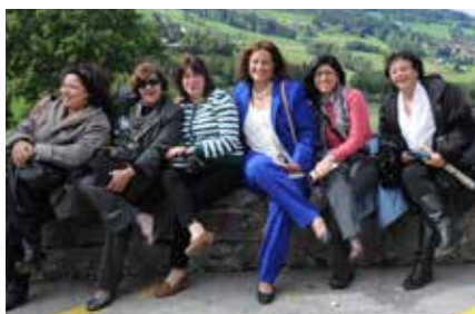
Comment promouvoir les femmes dans leur église, telle est la question qui intéresse prioritairement cette délégation de l'Eglise presbytérienne d'Egypte.