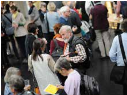
Séminaire de préparation au Dimanche de l'Eglise sur le thème «L'Eglise vous met en lien – Quelles connexions?»

«Je suis toujours étonnée de voir à quel point le secteur Paroisse et formation interagit à l'intérieur de la Maison de l'Eglise.» Ce constat très juste provient d'une collaboratrice d'un autre secteur. Les liens que nous avons tissés à l'intérieur de la Maison découlent directement de notre mission au service des paroisses, des autorités de l'Eglise, des bénévoles et des collaborateurs sur l'ensemble du territoire de l'Eglise. Nous avons aussi des contacts à l'extérieur de la Maison, avec des experts et des collègues d'autres Eglises et d'autres régions. Sans ce réseau, nous serions dans l'impossibilité de développer et d'améliorer sans cesse notre palette de cours, de formations, de conseils, d'outils de soutien et de colloques.