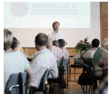
A l'hôtel-du-gouvernement à Berne et dans de nombreux locaux ecclésiastiques aux quatre coins des régions du territoire ecclésial: l'avenir de l'Eglise ne laisse pas indifférent de nombreuses personnes qui s'engagent pour elle.