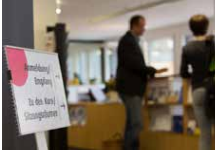
L'accueil à la Maison de l'Eglise.