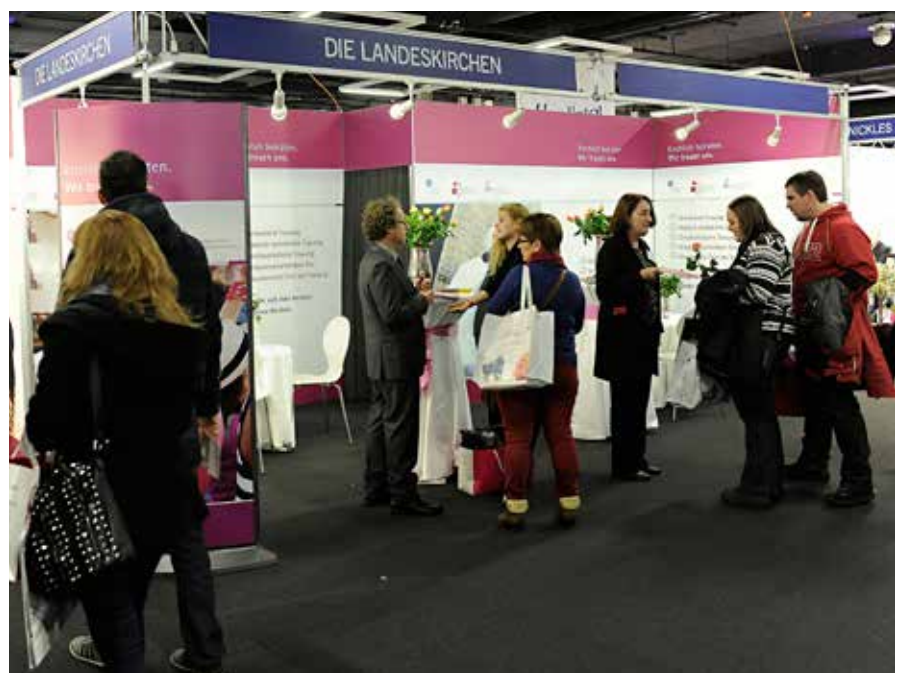
Le mariage religieux – Nous voulons nous marier à l'église : le stand des Eglises nationales au salon du mariage 2015 a attiré de nombreux curieux.