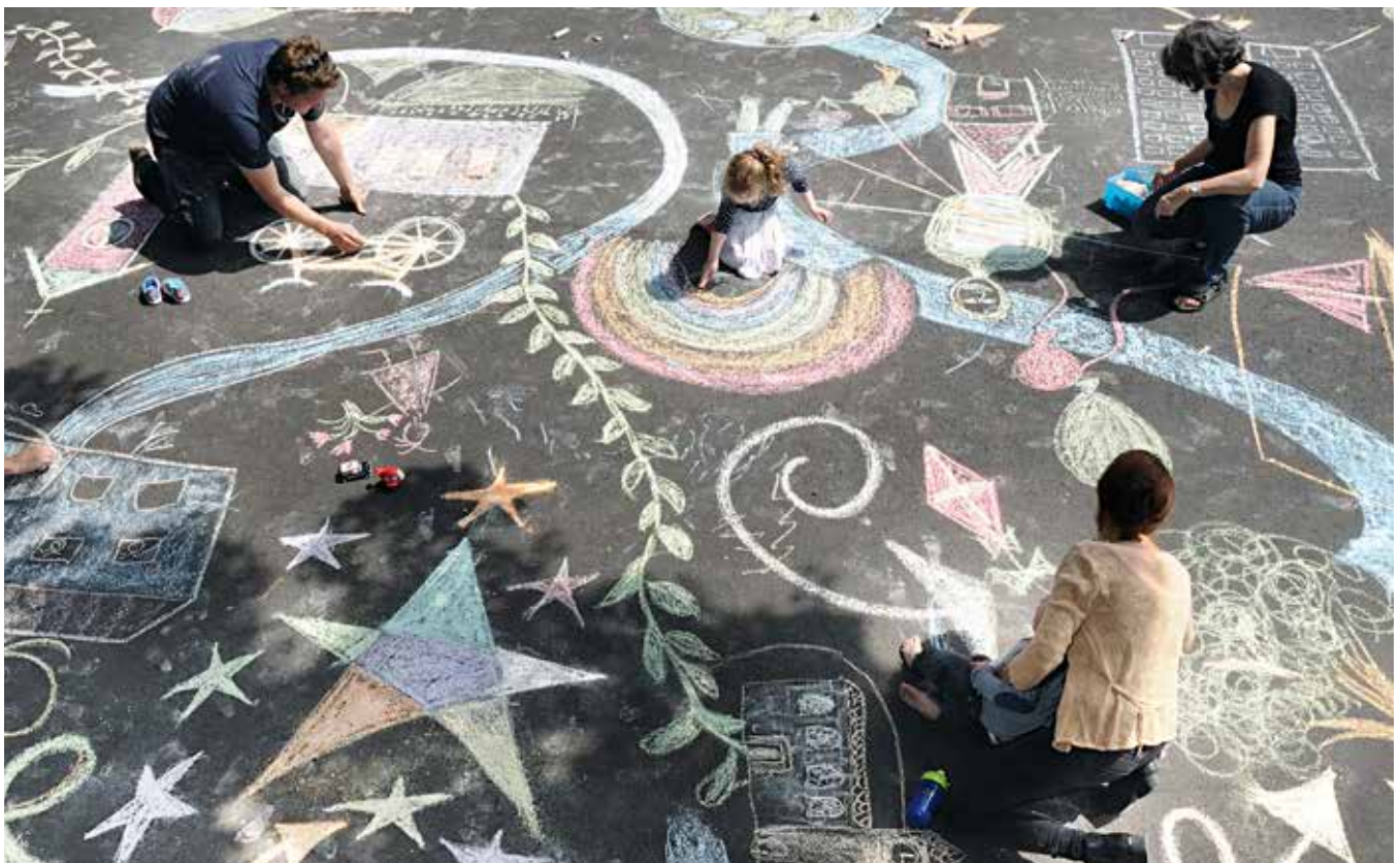
Les préparatifs du Dimanche de l'Eglise sur le thème «L'Eglise vous met en lien – Quelles connexions?»

Le dialogue entre ces deux univers n'a pourtant rien d'évident. L'Eglise, qui passe généralement pour une institution plutôt conservatrice, et le théâtre, en tant que