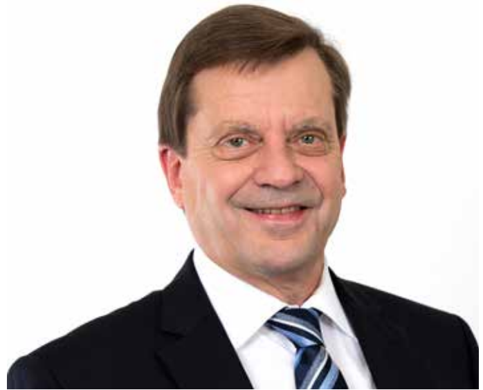
Andreas Zeller Président du Conseil synodal

Outre les trois chantiers prioritaires «Eglise et Etat», «Vision Eglise 21» et «jubilé de la Réforme», qui forment l'essentiel du nouveau programme de législation du conseil synodal, la présidence s'est occupée de la gestion des affaires courantes.