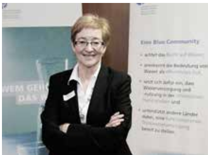
Maude Barlow, activiste sur les questions de l'eau et coinitiatrice de «Communauté bleue».