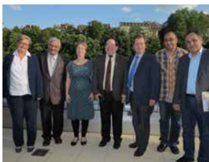
Visite de la délégation de l'Eglise presbytérienne à la Maison de l'Eglise.