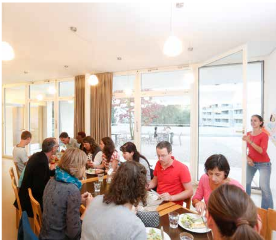
Vivre la communauté autour d'une même table.