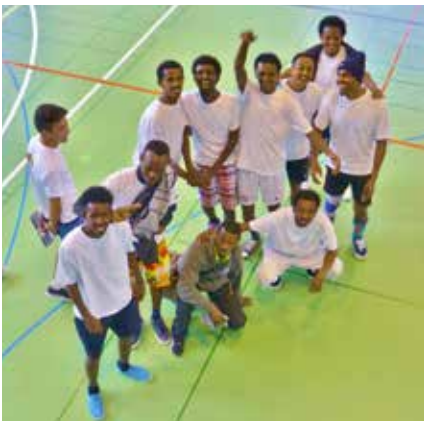
Des requérants d'asile lors d'un tournoi de football à Riggisberg.

En 2015, les «problèmes de migration» et la question des migrants ont été omniprésents dans le débat public. L'idée selon laquelle il fallait agir davantage dans les pays d'origine des réfugiés et des migrants a fréquemment été évoquée au niveau national; pourtant, au même moment, la Direction du développement et de la collaboration (DDC) se voyait imposer des restrictions budgétaires. Du côté ecclésial, les groupes paroissiaux CETN, les services cantonaux CETN et la FEPS sont tenus de renforcer constamment les bases de la solidarité internationale, d'empêcher que le développement et la migration ne se nuisent mutuellement et que des représentations naïves de la «restriction de la migration» ne deviennent le moteur de la coopération au développement. Dorénavant, en matière de coopération internationale, le pays le plus riche du monde sera bien obligé de faire sa part, et pas seulement par calcul. Avec plus de 60 autres organismes, les Eglises réformées Berne-Jura-Soleure soutiennent le lancement de l'initiative pour des multinationales responsables, qui montre clairement que le développement des pays dits du Sud implique nécessairement une transformation dans nos pays. Les entreprises ayant leur siège en Suisse sont tenues de respecter les droits humains sur l'ensemble de la planète et de se conformer aux standards environnementaux internationaux.