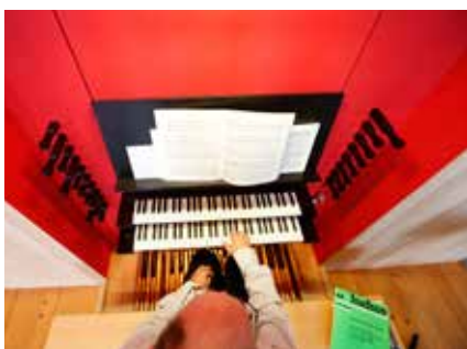
La musique d'église a été au cœur de l'année 2015.