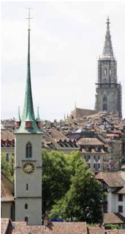
Le panorama sur la vieille ville de Berne est marqué par ses clochers.