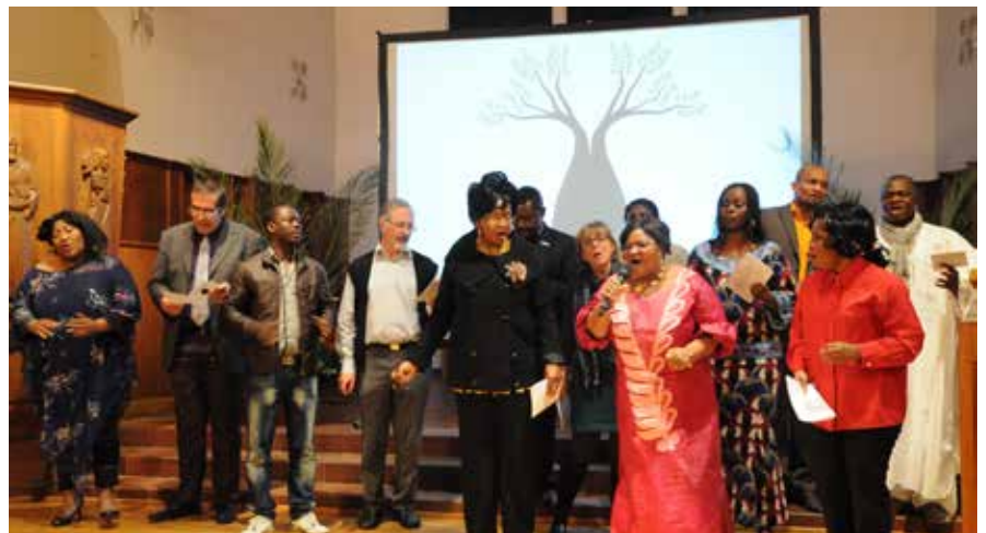
Le groupe biennois «Etre Eglise ensemble – Zusammen Kirche sein», lauréat du prix d'encouragement du service Migration.

Étant donné les besoins croissants d'accompagnement des paroisses sur les questions liées aux réfugiés, le secteur CETN a obtenu l'ouverture d'un poste à 40%, qui a pu être mis au concours avant la fin de l'année. Par ailleurs, le secteur a pu ouvrir un poste de stage de six mois pour approfondir la question de la portée internationale de la Réforme. Les résultats de ce travail sont valorisés dans la préparation du Jubilé 2017 de la Réforme.