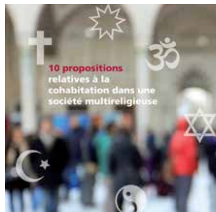
Un dépliant des Eglises nationales qui est désormais disponible dans les quatre langues nationales.