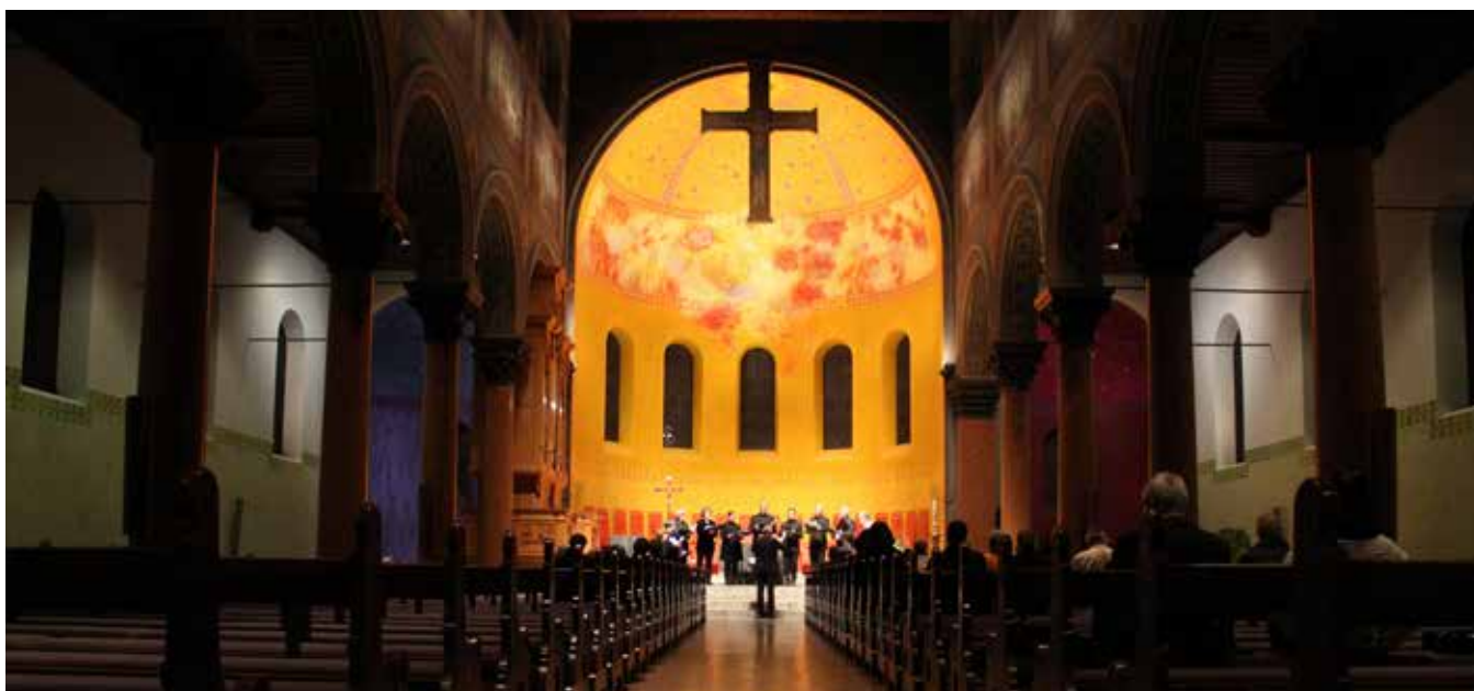
Les visiteuses et visiteurs de Cantars, le grand rassemblement œcuménique autour de la musique d'église, sont repartis avec pleins de bons souvenirs.

Responsable du service Développement des ressources humaines pour le corps pastoral