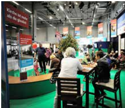
Le stand des Eglises nationales à la BEA 2015.

La 25 e participation des Eglises à la BEA était placée sous le thème «Eglise et Etat». Le titre du magazine unique des Eglises nationales paru à l'occasion de l'inauguration de la BEA – «L'Eglise, c'est plus que ce que tu crois» – a également servi de slogan pour le stand. Chaque jour, le populaire journaliste Roland Jeanneret, a invité des personnalités de l'Eglise à participer à une discussion publique. Dans le coin des selfies, jeunes et âgés ont pu se faire photographier, seuls ou en compagnie d'autres personnes, devant six scènes bibliques représentées en arrière-plan. Les activités très diversifiées de l'Eglise étaient exposées sur des panneaux et des affiches. Des œuvres d'entraide, la Société biblique, les services de consultation conjugale et familiale et l'association «Kirchlicher Verein Radio Berner Oberland» ont été accueillis en tant qu'invités du jour.