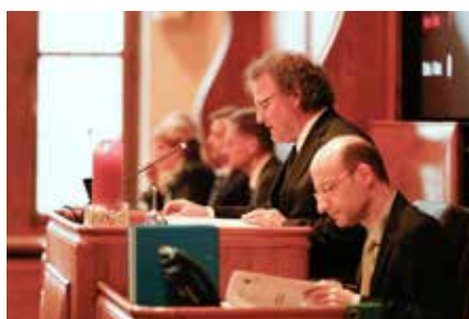
Attentif et concentré: le synode au travail.