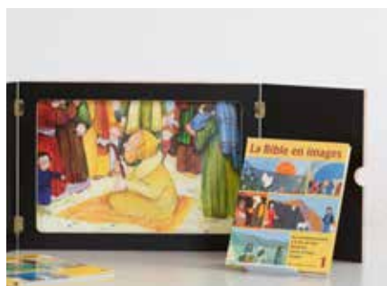
Matériel pédagogique en prêt.

■ Aller au-devant de l'autre dans le respect et la considération fait partie de la formation. Pour apprendre, il faut un «je», mais aussi un «tu» et un «nous». Nous encourageons les participantes et participants à se confronter à leur propre biographie et leur personnalité. On se connaît mieux au travers du regard de son vis-à-vis, du «tu». Le groupe (le «nous») favorise l'apprentissage social. La spiritualité devient alors ce qui permet à l'individu d'accéder à un tout qui le dépasse.