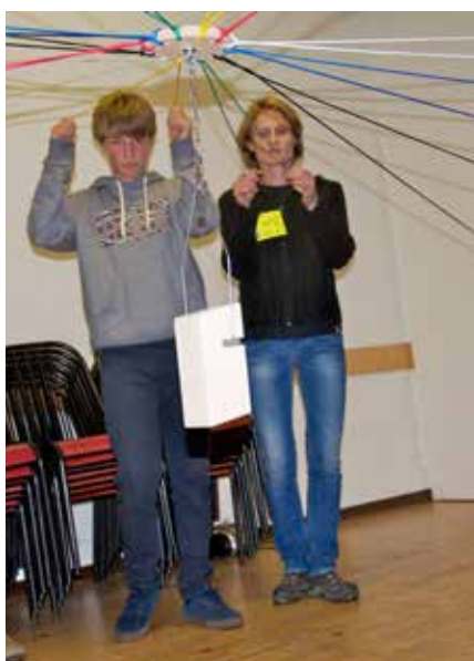
Exercices d'équipe lors du camp de confirmation.