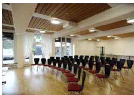
Grâce au service de maison, la salle Kurt Marti à la Maison de l'Eglise est prête à recevoir ses prochains visiteurs.

années précédentes. Mais de plus en plus souvent, certaines paroisses ne font pas le décompte de chaque collecte en raison de cultes communs célébrés avec d'autres paroisses. Cela est certes admis, mais il faut nous en avertir à l'avance pour que nous ne lancions pas inutilement des rappels qui irritent les responsables. Malheureusement, nous avons dû envoyer l'année passée des rappels de paiement à quelques paroisses parce qu'elles avaient procédé à certaines collectes sans notre consentement.