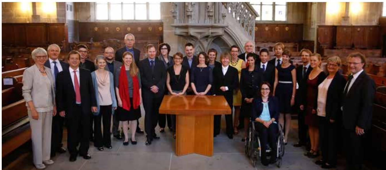
Les participantes et participants à la célébration de consécration à la collégiale de Berne.

Présidente de la Commission jurassienne de liturgie