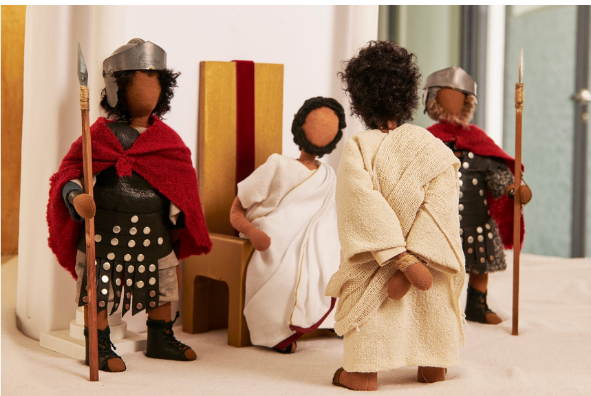
Jesus vor Pilatus 2 v