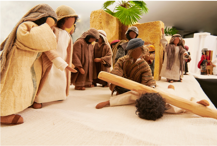
Jesus trägt sein Kreuz 1 Jesus trägt sein Kreuz 2 >