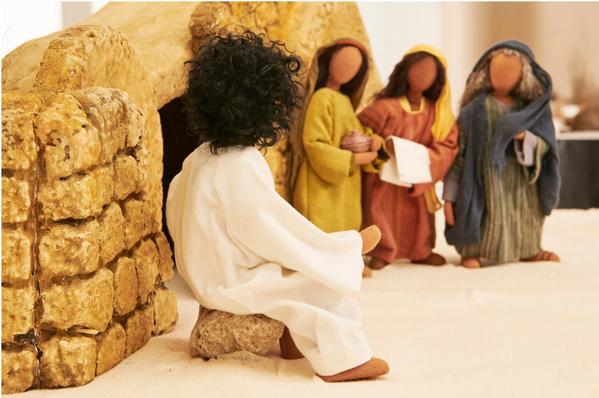
Ostern: Jesus ist auferstanden 3