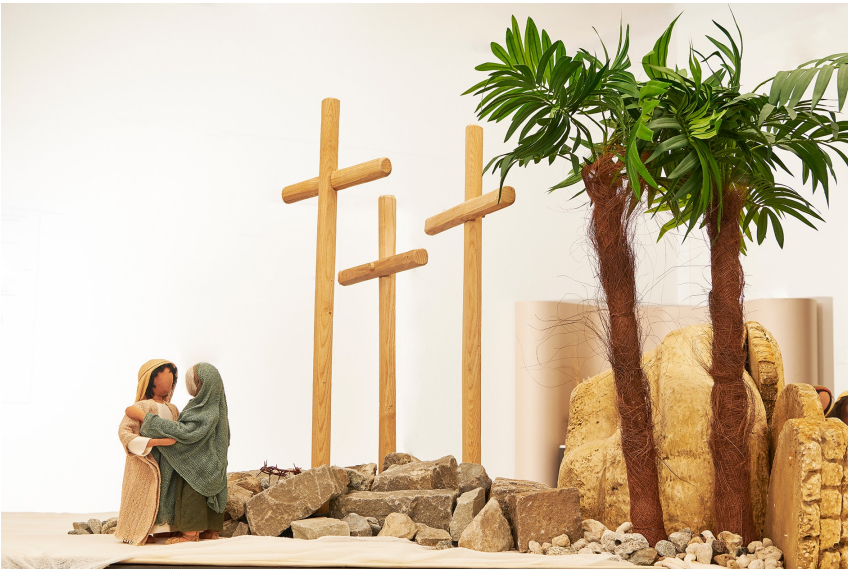
Maria + Johannes unter dem Kreuz 2 v