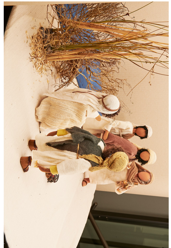
Ostern: Jesus und seine Jünger