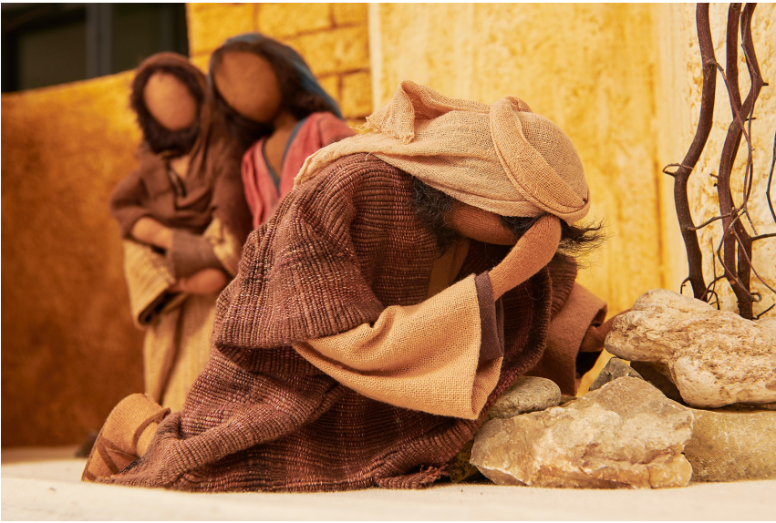
Petrus verleugnet Jesus