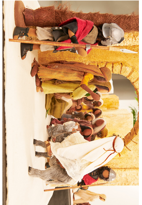
Einzug in Jerusalem 2