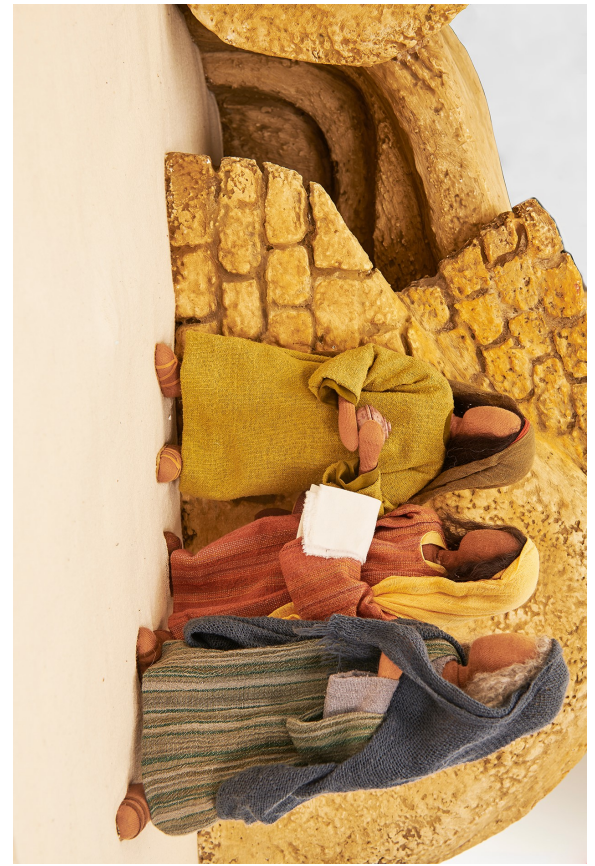
Ostern: Jesus ist auferstanden 2