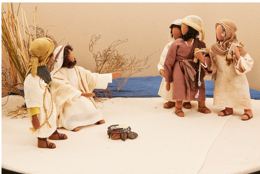
Ostern: Jesus und seine Jünger 2