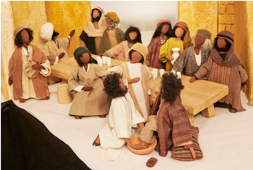
Jesus wäscht Füße 1