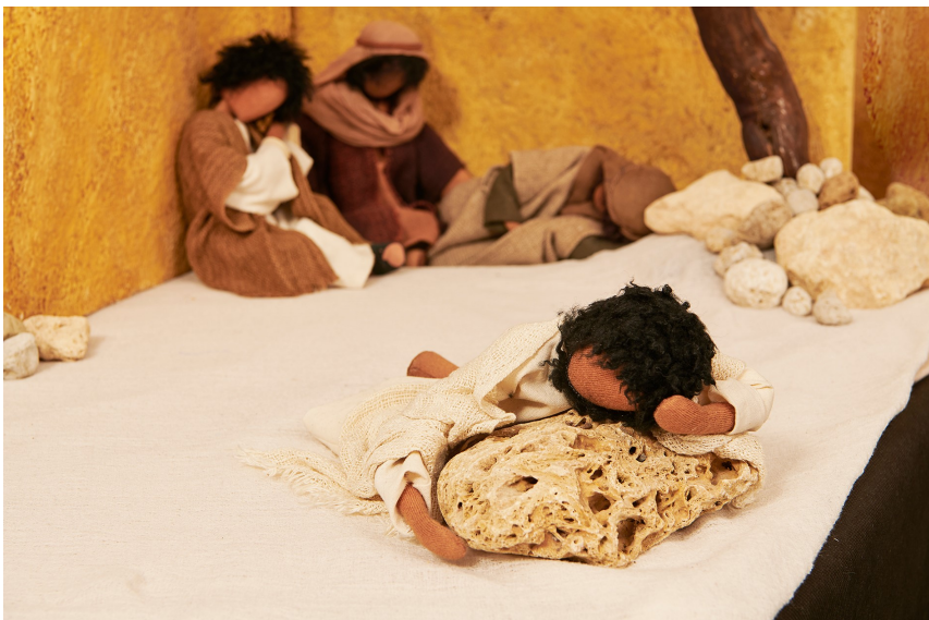
< Jesus betet im Garten