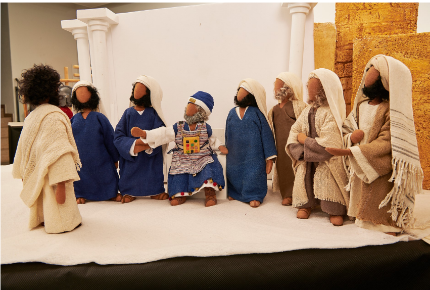
Jesus vor Pilatus 1 >