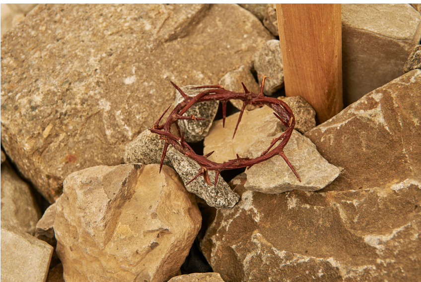
Dornenkrone - Jesus stirbt am Kreuz v