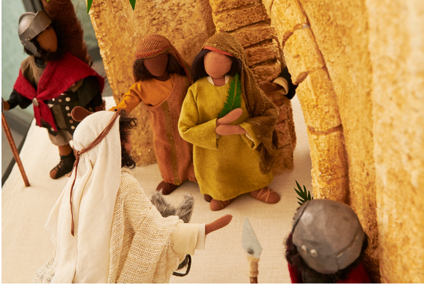
Einzug in Jerusalem 1