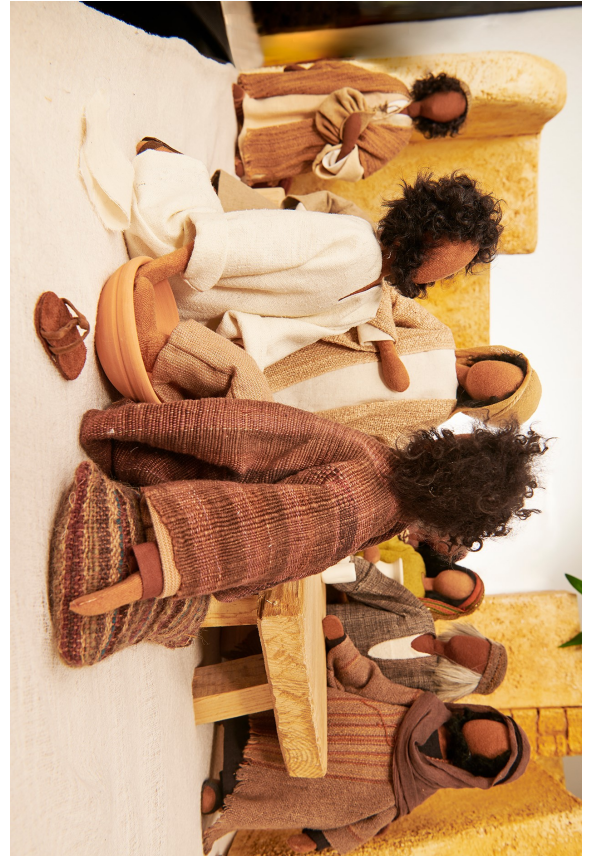
Jesus wäscht Füße 2