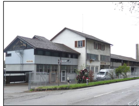
Unterbringung in Kollektivunterkunft durch regionalen Partner. Zu späterem Zeitpunkt Unterbringung in individuellen Wohnungen .