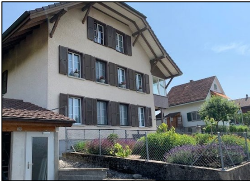
Privatunterbringung bei Gastfamilien