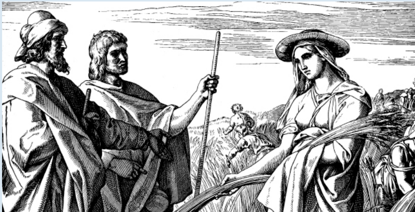
«Ruth auf dem Acker des Boas», Ruth 2, 8 und 9 (s. Seite 8)

schieben. Sie ist daran, aus ihrer Gründerfigur – demselben Roberto d'Aubuisson, der die Ermordung Romeros in Auftrag gab – einen nationalen Mythos zu kreieren, indem sie ihm öffentliche Plätze weihet und Sonderbeilagen in Zeitungen widmet. Das zeigt einmal mehr, wie es um den politischen Willen steht, nicht nur die Ermordung Romeros aufzuklären, sondern den über 75'000 Toten des Bürgerkrieges Gerechtigkeit widerfahren zu lassen. Um den Forderungen des IAM Nachdruck zu verschaffen, gründeten verschiedene Aktivist/innen aus der Zivilgesellschaft 2007 die Comision de seguimiento del caso Monseñor Romero. Sie bringt mit öffentlichen Kundgebungen, Motionen im Parlament und Besuchen an Schulen und Ausbildungszentren sowohl die Brisanz der Forderungen des IAM als auch die Arroganz der Regierenden ins Bewusstsein der Zivilgesellschaft.