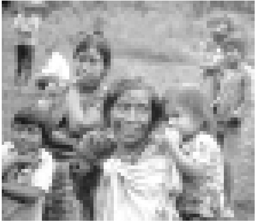
Vertriebene kehren nach jahrelangem Exil in den Urwäldern Mexikos in ihre guatemalteckische Heimat, den Ixcán, zurück.