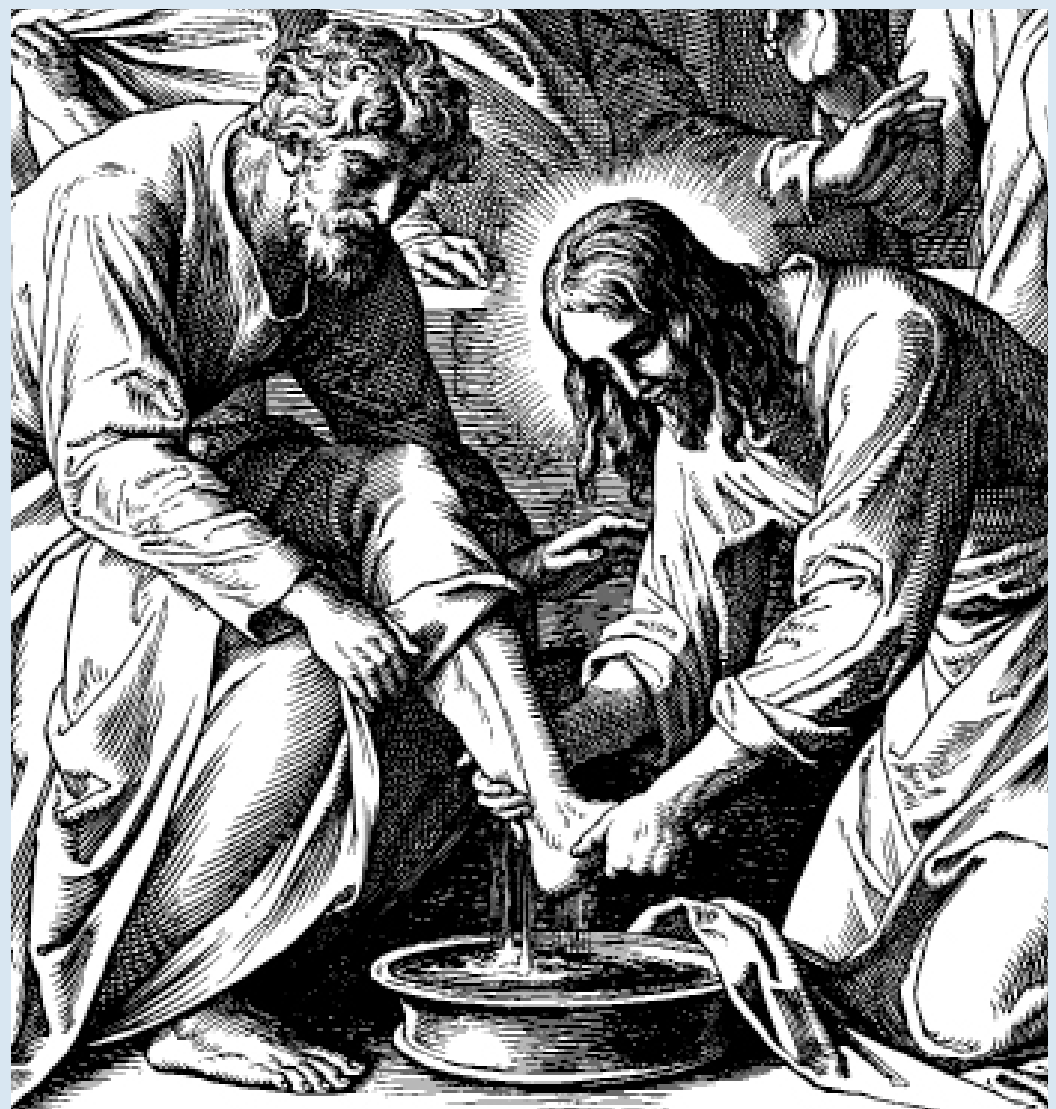
«Die Fusswaschung», Job. 13, 2 - 5 s. Seite 8

wie sollte ich wissen? wie kann überhaupt irgendwer wissen da im dickicht der welt die schlupfwege meist nur schwer einsehbar bleiben auf denen ER der anführer des lebens bosheit und niederlagen untaten und tode von tag zu tag unterwandert?