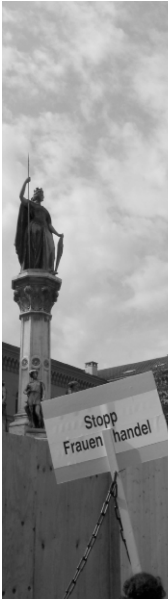
Auf dem Weg zur Petitionsübergabe