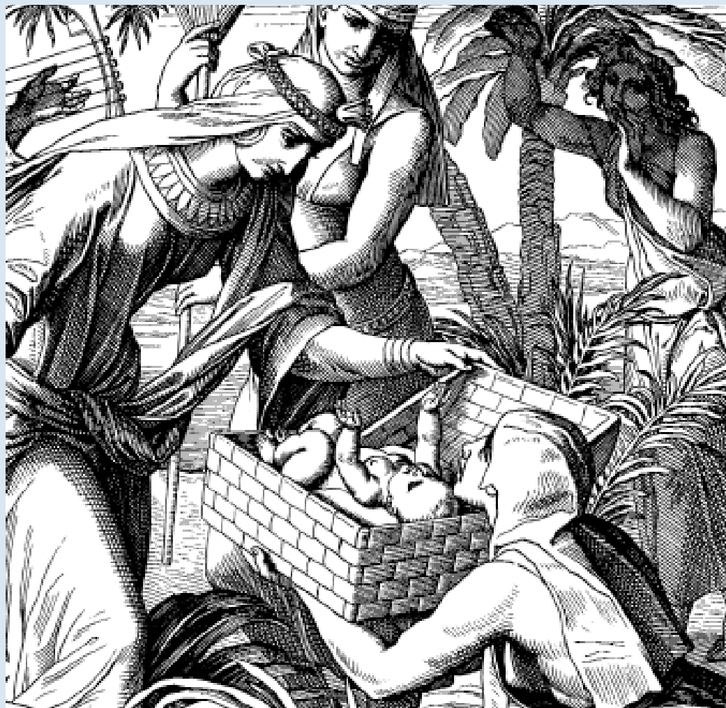
«Die Findung Mosis», Ex. 2, 5 und 6 (s. Seite 8)