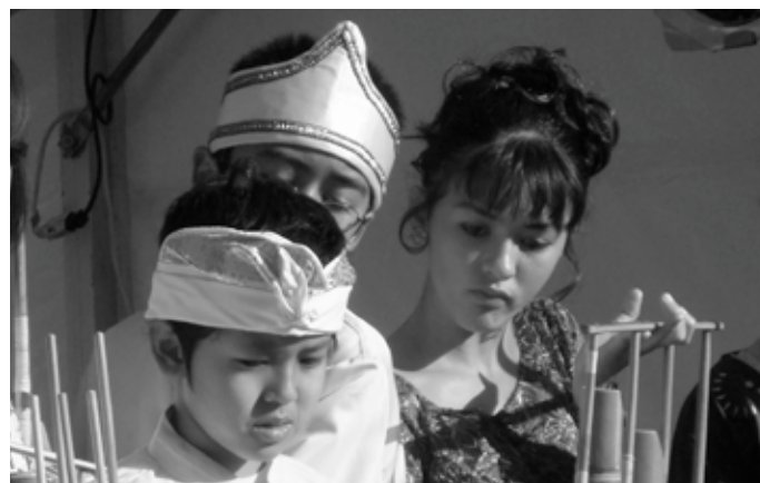
Am Fête KultuRel