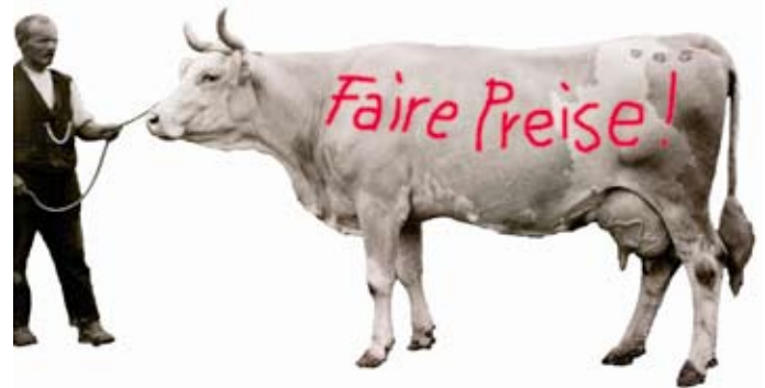
Bild: aus dem Buch von Markus Schürpf: Arthur Zeller 1881–1931, Vieh- und Wanderfotograf im Simmental, Limmat Verlag, Zürich 2008. Grafische Gestaltung: Marc Zaugg

Anders produziertes Fleisch – aus intensiver Tierhaltung mit hohem Einsatz von Kraftfutter – ist billiger zu kaufen, bedeutet aber für die Bauern im Oberland eine grosse Konkurrenz und für die Kleinbauern eine Gefahr. Denn das Kraftfutter besteht aus einem bedeutenden Anteil aus billigem Soja, mit grösster Wahrscheinlichkeit aus Brasilien. Kleinbauern in Brasilien, welche durch riesige Soja-Monokulturen ihre Existenzen verlieren, sind ähnlich von der internationalen Agrarpolitik und einer wachsenden industriellen Landwirtschaft betroffen wie Bauern im Oberland.