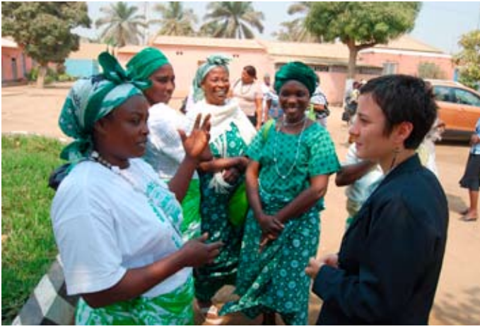
Im Gespräch bei einem kirchlichen Frauentreffen in Angola