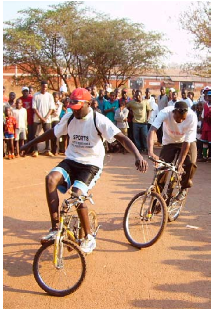
Sportstag von YAZ im Township Kuwadzana

Missbrauch von Jungen durch Ältere, schlecht entwickeltes Selbstvertrauen und wenig Selbständigkeit im Denken und Handeln, frühe Heiraten, Frustration und Neigung zu Gewalt, Instrumentalisierung von jugendlichen Schlägern durch Politiker usw. fepa -Projekte greifen hier ein durch die gezielte Unterstützung von Organisationen von Jungen für Junge.