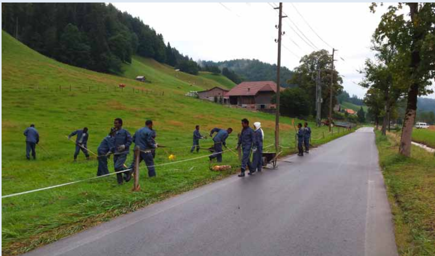
Insgesamt 60 Asylsuchende beteiligten sich an den Aufräumeinsätzen in Rüti bei Riggisberg und Thurnen nach Überschwemmungen im August 2014. (Foto: Martin Trachsel)

(588'000), Kenia (537'000) und Tschad (455'000). An die 90 Prozent der Flüchtlinge bekommen in armen Ländern Schutz, nur die wenigsten in den industrialisierten Staaten. Das Beispiel Syrien bestätigt die Regel: Nur etwa vier Prozent der syrischen Flüchtlinge haben in europäischen Ländern um Asyl gebeten. Derweil hat zum Beispiel der Libanon mittlerweile eine Anzahl an syrischen Flüchtlingen aufgenommen, die einen Viertel seiner eigenen Bevölkerungszahl übersteigt. Mangels legaler Möglichkeiten greifen die wenigen, die in ihrer Verzweiflung den Weg nach Europa wagen, oft zu drastischen Mitteln; durchqueren Wüsten, flüchten mit seeuntüchtigen Booten über das Meer, klammern sich unter Lastwagen fest und vertrauen sich skrupellosen Schleppern an, um es über die Grenzen zu schaffen.