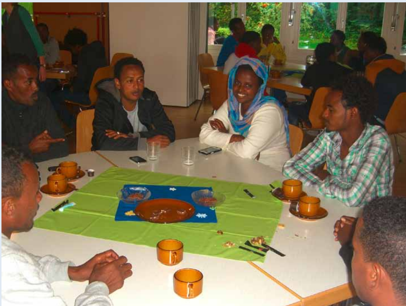
Jeden Dienstagnachmittag besuchen zwischen 50 und 60 Besucherinnen und Besucher das «Café Regenbogen» im Kirchgemeindehaus Riggisberg. Begegnungsmöglichkeiten bewirken, dass Misstrauen im Dorf abgebaut und Vertrauen aufgebaut wird.