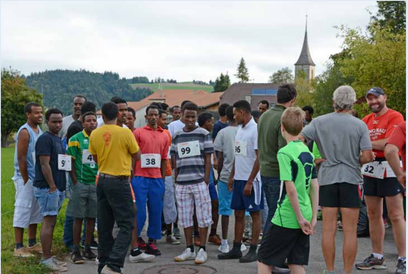
17 Läuferinnen und Läufer aus Eritrea nahmen am Hauptlauf teil und bolten in verschiedenen Kategorien drei Podestplätze. Insgesamt beteiligten sich 32 Eritreerinnen und Eritreer am Oberbalmer Bettagslauf vom 13. September 2014.