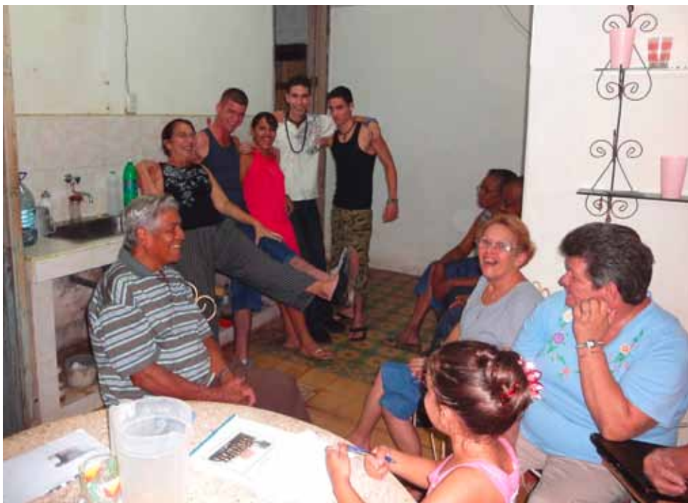
Remedios: fröhliches Gemeindeleben mit jung und alt

Die Arbeitsgruppe OEME des ehemaligen kirchlichen Bezirks Schwarzenburg (Schwarzenburg, Abligen, Guggisberg, Rüschegg) war von jeher auf Gemeindepartnerschaften ausgerichtet, zuerst mit Ungarn und jetzt mit Kuba. Die Partnerschaften geben der weltweiten Kirche ein Gesicht und beleben das Gemeindeleben in unserer Region. Sie zeigen Wege auf, wie Reichtum und Armut geteilt werden können, brauchen aber auch einen langen Atem.