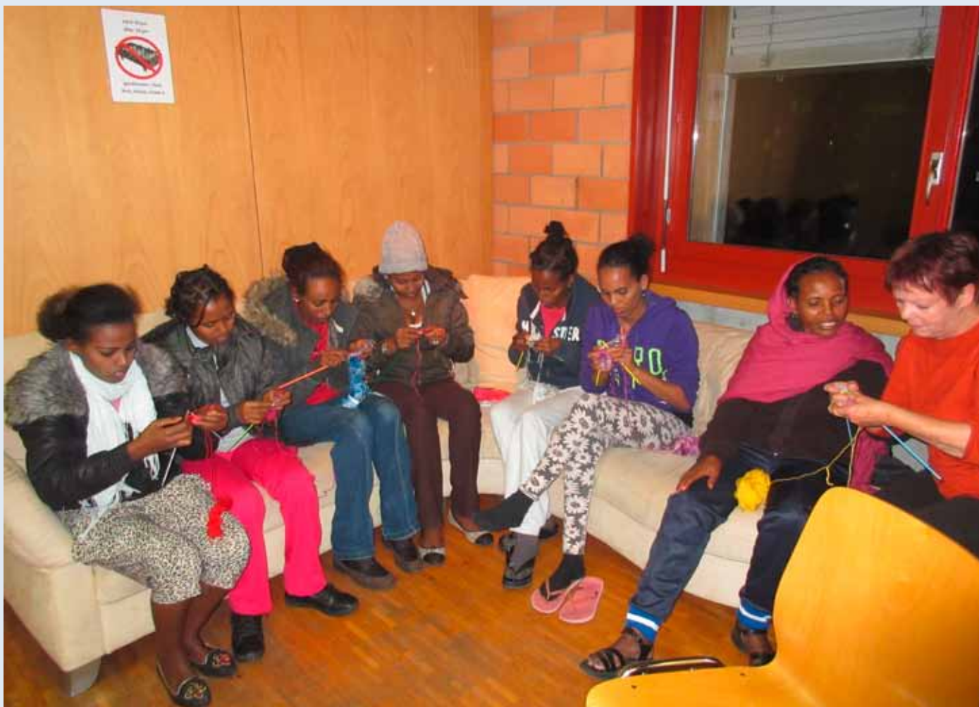
Jeweils am Donnerstag Nachmittag leiten Freiwillige im Durchgangszentrum Riggisberg Asylsuchende beim Stricken und Nähen an.