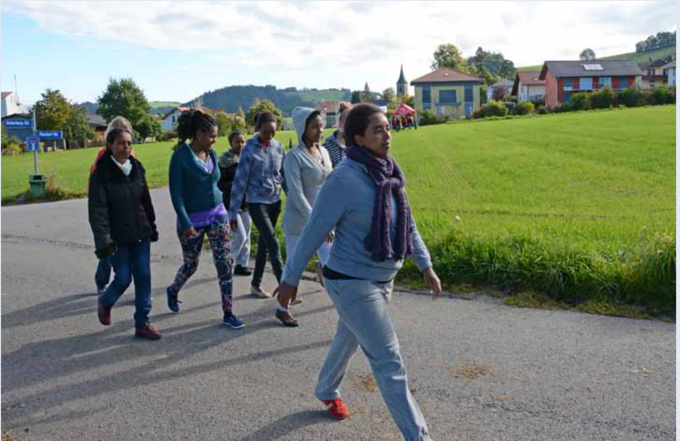
Eine Gruppe Frauen, die im Durchgangszentrum für Asylsuchende in Riggisberg untergebracht sind, macht sich auf zum Bettagslauf vom 13. September 2014 in Oberbalm.