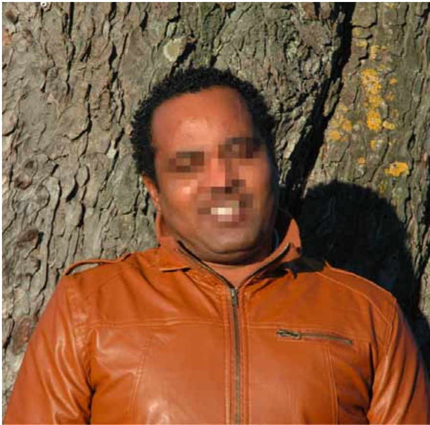
Asylsuchender: «Das Kostbarste ist mir die Freiheit.»

ren in Kanada lief. Sie flogen mich zurück nach Addis Abeba, wo die Polizei mich schon erwartete und auf der Stelle ins Gefängnis brachte. Nach drei Jahren kam ich auf Kaution frei. Zurück in Freiheit schlug ich mich mit Natelreparaturen durch. Doch nachdem eine private Zeitung mich zu den Parlamentswahlen von 2010 befragt hatte, die meiner Meinung nach Scheinwahlen waren, wurde ich erneut verhaftet und erst nach sieben Monaten auf Kaution frei wieder gelassen. Ich war 28 Jahre alt und hatte bereits in drei Ländern wegen meiner politischen Gesinnung und meiner Versuche, in einem sicheren Land Asyl zu erhalten, im Gefängnis verbracht – zusammengezählt mehr als siebeneinhalb Jahre! Mein Land ist mir wichtig – deshalb kämpfe ich für mehr Demokratie. Aber ich will nicht wie mein Vater enden.