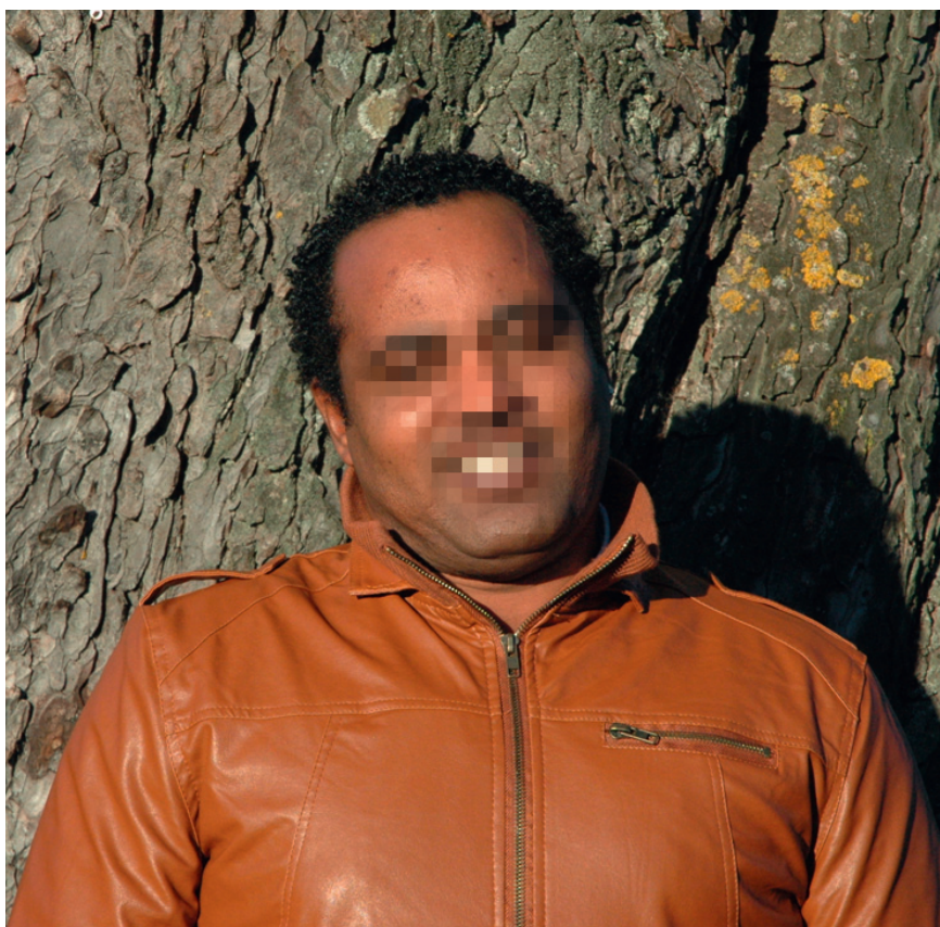
Asylsuchender: «Das Kostbarste ist mir die Freiheit.»

ren in Kanada lief. Sie flogen mich zurück nach Addis Abeba, wo die Polizei mich schon erwartete und auf der Stelle ins Gefängnis brachte. Nach drei Jahren kam ich auf Kaution frei. Zurück in Freiheit schlug ich mich mit Natelreparaturen durch. Doch nachdem eine private Zeitung mich zu den Parlamentswahlen von 2010 befragt hatte, die meiner Meinung nach Scheinwahlen waren, wurde ich erneut verhaftet und erst nach sieben Monaten auf Kaution frei wieder gelassen. Ich war 28 Jahre alt und hatte bereits in drei Ländern wegen meiner politischen Gesinnung und meiner Versuche, in einem sicheren Land Asyl zu erhalten, im Gefängnis verbracht – zusammengezählt mehr als siebeneinhalb Jahre! Mein Land ist mir wichtig – deshalb kämpfe ich für mehr Demokratie. Aber ich will nicht wie mein Vater enden.