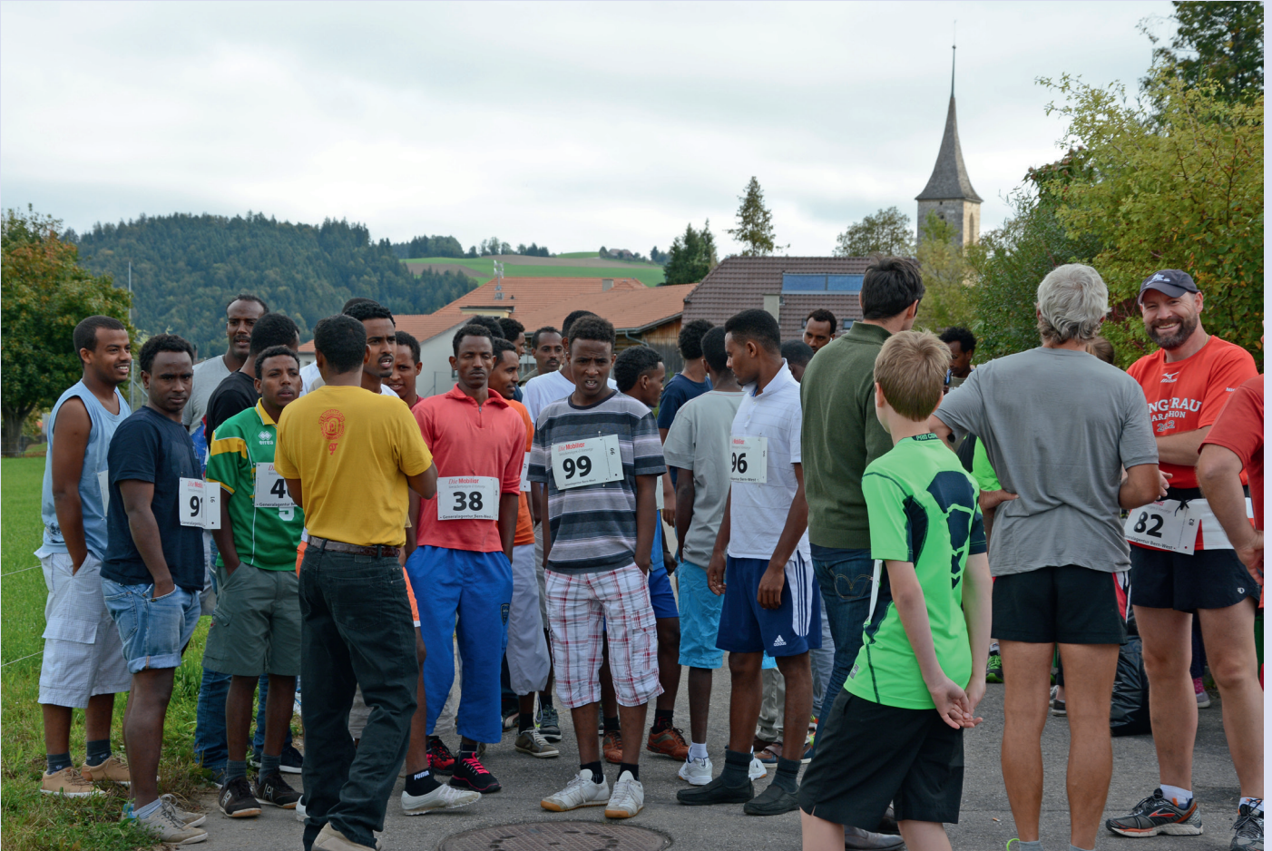
17 Läuferinnen und Läufer aus Eritrea nahmen am Hauptlauf teil und bolten in verschiedenen Kategorien drei Podestplätze. Insgesamt beteiligten sich 32 Eritreerinnen und Eritreer am Oberbalmer Bettagslauf vom 13. September 2014. (Foto: Christian Niedermann).