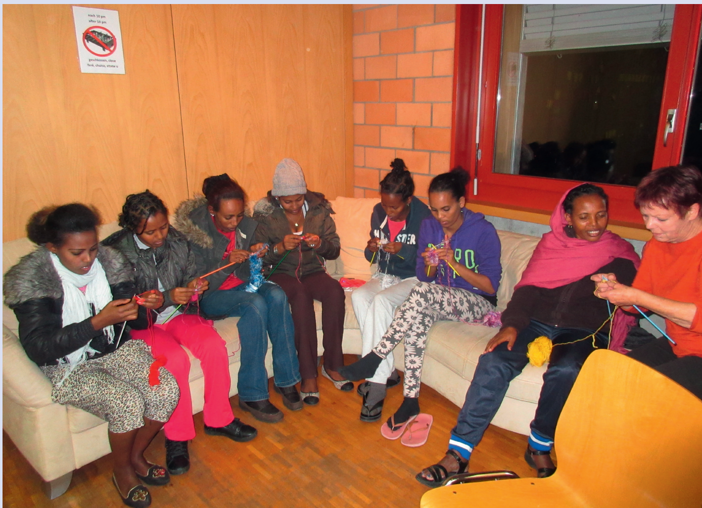
Jeweils am Donnerstag Nachmittag leiten Freiwillige im Durchgangszentrum Riggisberg Asylsuchende beim Stricken und Nähen an.