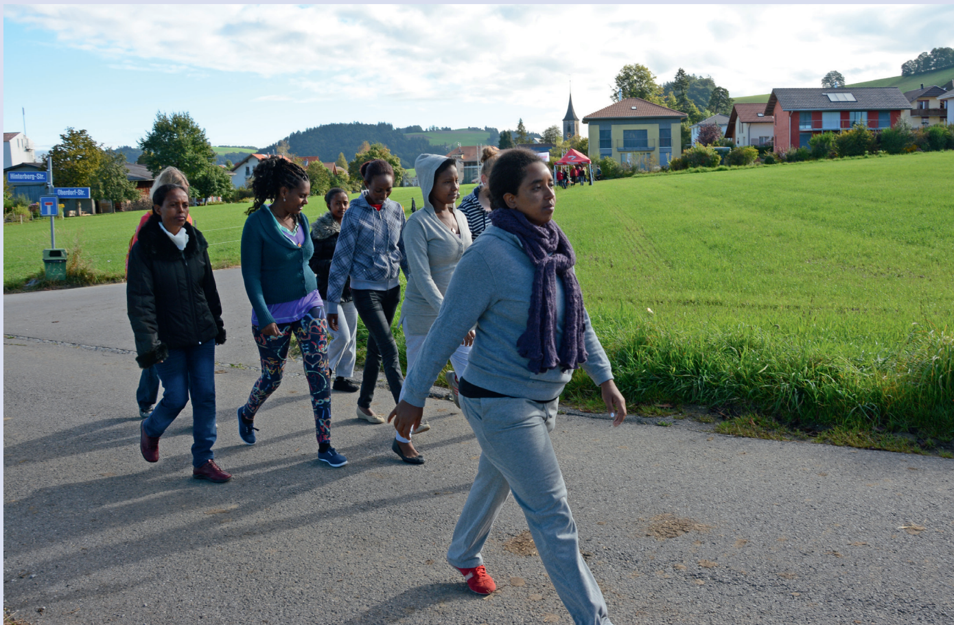
Eine Gruppe Frauen, die im Durchgangszentrum für Asylsuchende in Riggisberg untergebracht sind, macht sich auf zum Bettagslauf vom 13. September 2014 in Oberbalm.