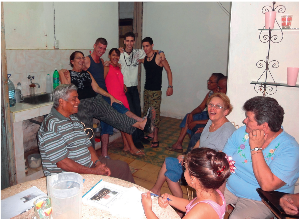
Remedios: fröhliches Gemeindeleben mit jung und alt

Die Arbeitsgruppe OEME des ehemaligen kirchlichen Bezirks Schwarzenburg (Schwarzenburg, Abligen, Guggisberg, Rüschegg) war von jeher auf Gemeindepартnerschaften ausgerichtet, zuerst mit Ungarn und jetzt mit Kuba. Die Partnerschaften geben der weltweiten Kirche ein Gesicht und beleben das Gemeindeleben in unserer Region. Sie zeigen Wege auf, wie Reichtum und Armut geteilt werden können, brauchen aber auch einen langen Atem.