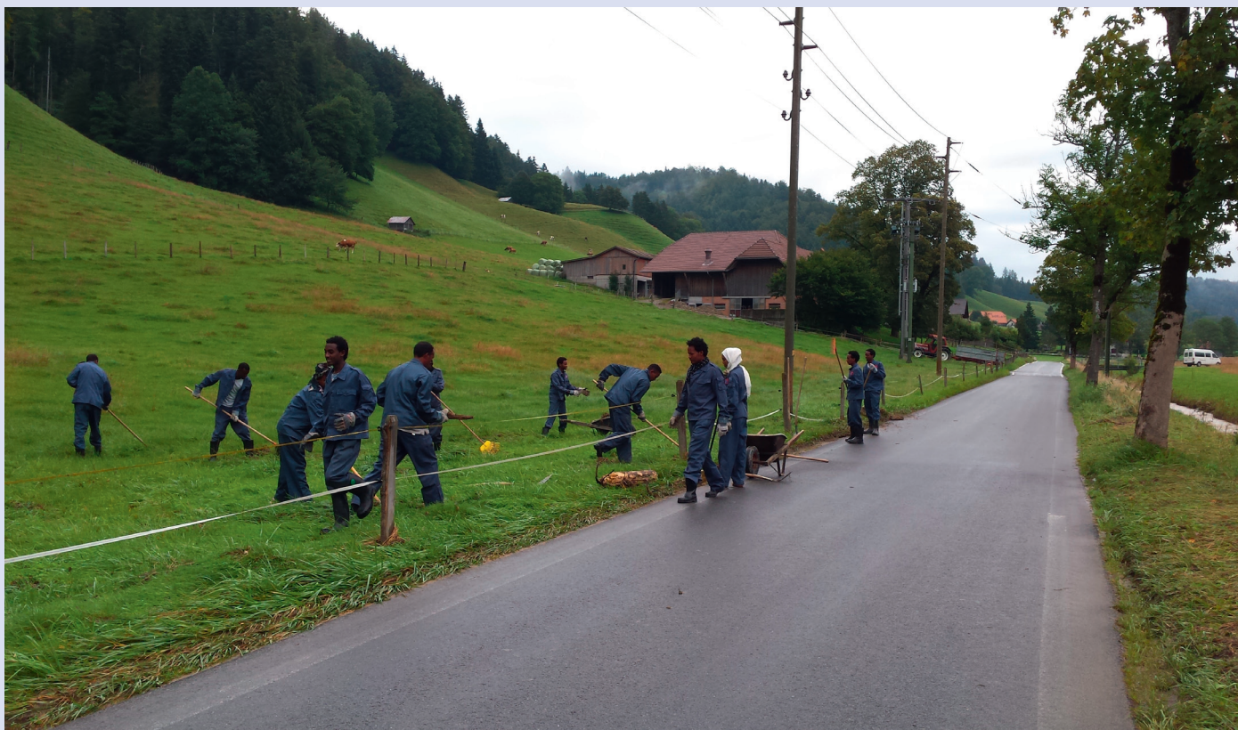
Insgesamt 60 Asylsuchende beteiligten sich an den Aufräumeinsätzen in Rüti bei Riggisberg und Thurnen nach Überschwemmungen im August 2014.

(588'000), Kenia (537'000) und Tschad (455'000). An die 90 Prozent der Flüchtlinge bekommen in armen Ländern Schutz, nur die wenigsten in den industrialisierten Staaten. Das Beispiel Syrien bestätigt die Regel: Nur etwa vier Prozent der syrischen Flüchtlinge haben in europäischen Ländern um Asyl gebeten. Derweil hat zum Beispiel der Libanon mittlerweile eine Anzahl an syrischen Flüchtlingen aufgenommen, die einen Viertel seiner eigenen Bevölkerungszahl übersteigt. Mangels legaler Möglichkeiten greifen die wenigen, die in ihrer Verzweiflung den Weg nach Europa wagen, oft zu drastischen Mitteln; durchqueren Wüsten, flüchten mit seeuntüchtigen Booten über das Meer, klammern sich unter Lastwagen fest und vertrauen sich skrupellosen Schleppern an, um es über die Grenzen zu schaffen.