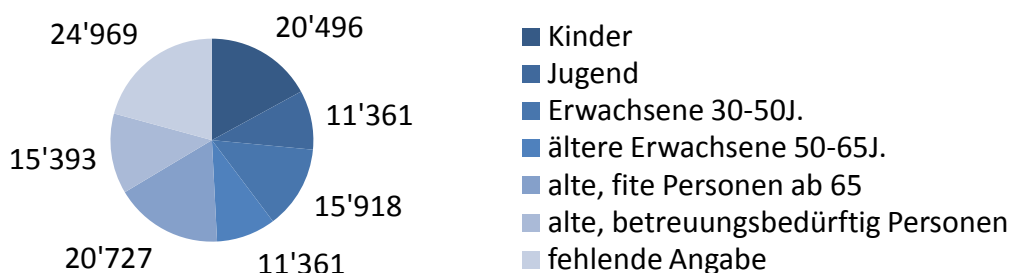
Grafik 1: Arbeitsstunden pro Altersgruppe*

Diese Stunden entsprechen in der Arbeit mit ... (in Klammer Hochrechnung fürs Kirchengebiet (KGB))