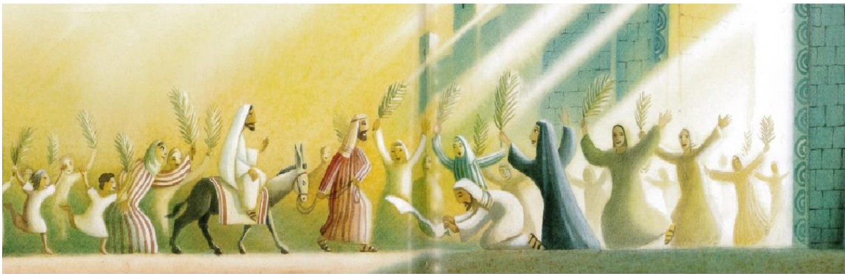
die Ostergeschichte

Jesus und seine Freundinnen und Freunde sind auf dem Weg nach Jerusalem. Jerusalem ist die Hauptstadt des Landes, wo die Juden leben. Dort steht auch der Tempel, das Haus, in dem viele Juden zu Gott beten. In Jerusalem wollen Jesus und seine Freundinnen und Freunde zusammen das Pessach-Fest feiern. Dieses Fest erinnert die Juden, wie ihr Volk vor langer Zeit in Ägypten gefangen war. Gott schickte Moses und befreite sie. Jesus schickt zwei Freunde voraus, damit sie für ihn einen Esel organisieren. Auf dem Esel reitet Jesus in die Stadt hinein. Die Leute stehen an der Strasse und jubeln ihm zu. Sie empfangen ihn wie einen König; ein König nicht auf einem Pferd, aber auf einem Esel. Jesus ist ein König der Frieden bringen soll. Viele Menschen halten Palmenzweige in den Händen, legen ihre Kleider auf die Strasse und rufen: Hosanna, Hosanna. Das bedeutet: «Gott, hilf uns!»