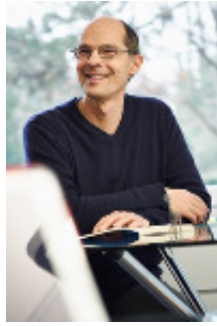
Martin Bauer Beratung KUW Kontakt