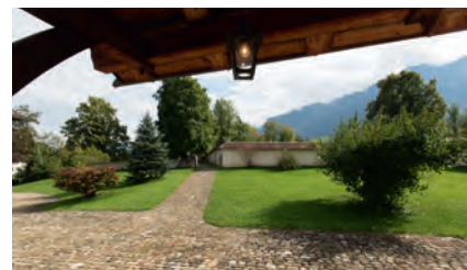
Les Eglises à la campagne: lieu de méditation, avec vue sur les environs.