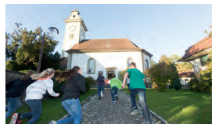
Des enfants d'une classe de catéchèse découvrent à leur manière «leur» Eglise à Stettlen.

«Quant au fondement, nul ne peut en poser un autre que celui qui est en place: Jésus-Christ.» (1 Co 3,11). S'il existe une application théologiquement valable de la notion de «desserte pastorale de base», alors il s'agit bien de celle évoquée dans ce verset. Une desserte pastorale de base n'est pas quelque chose que l'Eglise saurait garantir par elle-même, mais c'est le fondement posé avant toute autre chose par le Christ lui-même. Ce qui signifie que l'Eglise n'est pas son propre fondement, ni qu'elle ne dure par elle-même. Avant tout agir de l'Eglise, et au-delà de toute diminution de postes voulue par l'Etat, le fondement de l'Eglise et sa «desserte pastorale de base» sont garantis.