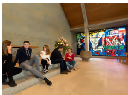
Donner une voix aux jeunes dans l'Eglise.