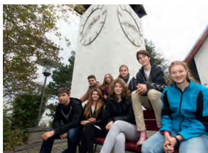
Les jeunes devant l'Eglise de Spiegel.