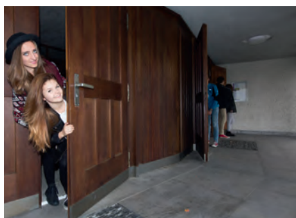
«Coucou! Y a-t-il quelque chose à découvrir dans cette Eglise?»

En collaboration avec tous les collaborateurs du secteur