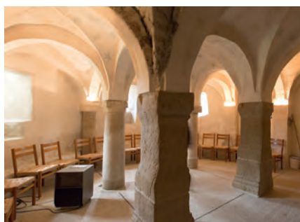
Le crypte de l'Eglise d'Amsoldingen: lieu de silence et de prière sur le chemin de Saint-Jacques.

Ce service a élaboré un concept très fouillé des ressources humaines pour le corps pastoral, qui, en février 2014, a été longuement discuté puis accepté par le Conseil synodal. Son but consiste à accompagner les pasteurs et pasteuses dans leur travail exigeant, de les encourager et de les mettre en réseau les uns avec les autres. Un des aspects primordiaux concerne la prévention dans les domaines de la gestion de la santé et des conflits. Grâce à une étroite collaboration avec la Formation continue et grâce à une mise en réseau étendue à toute la Suisse, il est possible de prévoir des mesures et de mettre différentes offres à disposition. Les idées maîtresses du concept des ressources humaines pour le corps pastoral et de sa promotion, ainsi que les nouveaux descriptifs de postes (despo) ont été présentés aux Conférences pastorales.