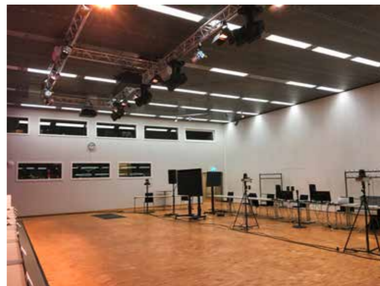
Installations techniques à BERNEXPO pour le Synode d'hiver virtuel