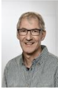
Stefan Zwygart Redaktion Newsletter, Auskunft und Beratung KUW Kontakt